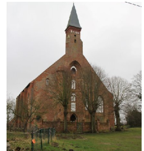
Der ökumenische Festgottesdienst ist am 11. Juni in der Klosterkirche.