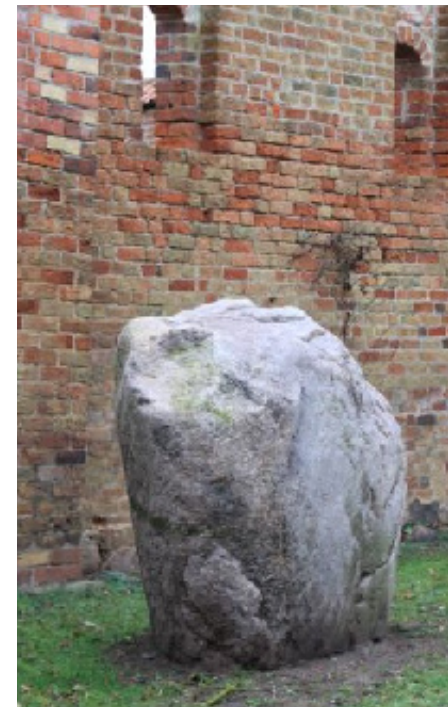
Der Stein soll Zeugnis der 800 Jahre alten Geschichte des Klosters sein.