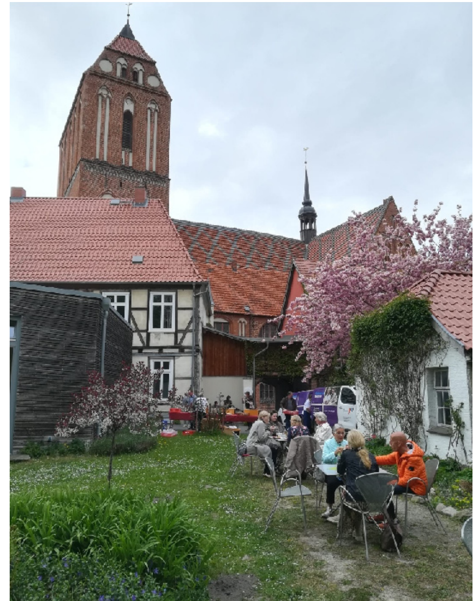
Imbiss und Begegnungen anlässlich 20 Jahre ambulanter Hospizdienst.