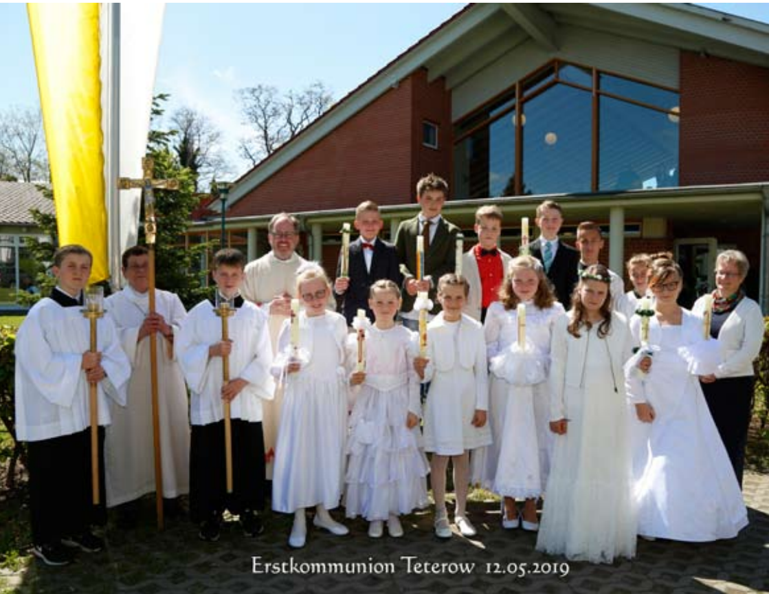
Erstkommunion Teterow 12.05.2019