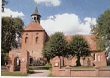
Evangelische Kirche Schorrentin