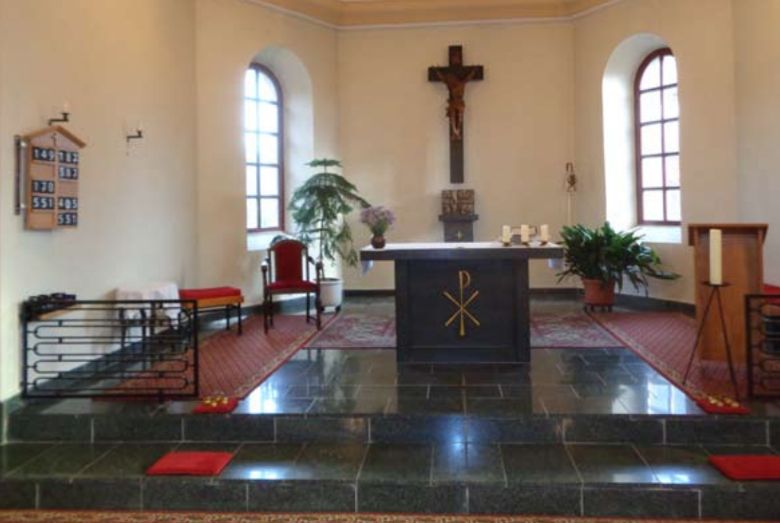
St. Michael, Raden (s. S.16/17)