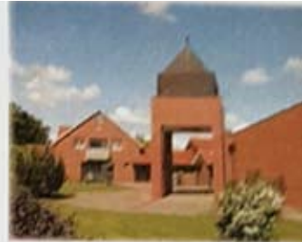
Katholische Kirche Neukalen