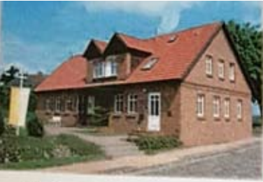
Katholische Kapelle Dargun