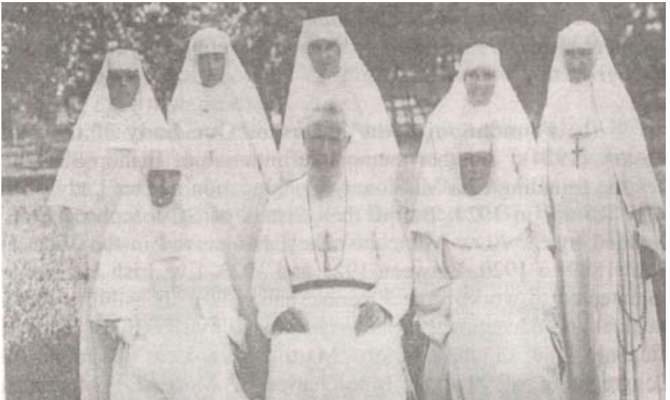
Bischof Joseph Shanahan mit einigen der ersten Holy Rosary (Rosenkranz) Ordensschwestern, die in Nigeria arbeiteten.